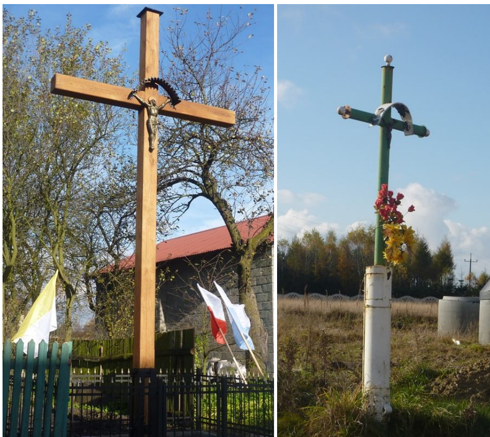
Zdjęcie nr 5. Krzyże przydrożne w miejscowości

W Miąsowej jak w każdej miejscowości o charakterze wiejskim w jej krajobraz wpisują się przydrożne kapliczki i krzyże świadczące o religijnym charakterze mieszkańców. Na zebraniu roboczym mieszkańcy wskazali, że w miejscowości jest 6 krzyży przydrożnych.