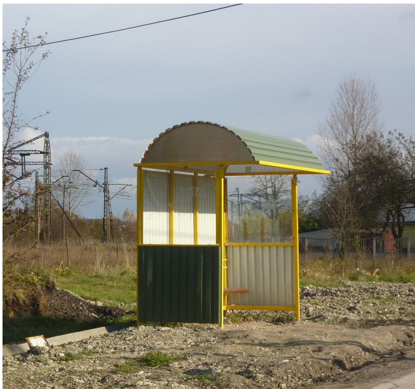
Zdjęcie nr 13. Przystanek autobusowy w miejscowości Miąsowa