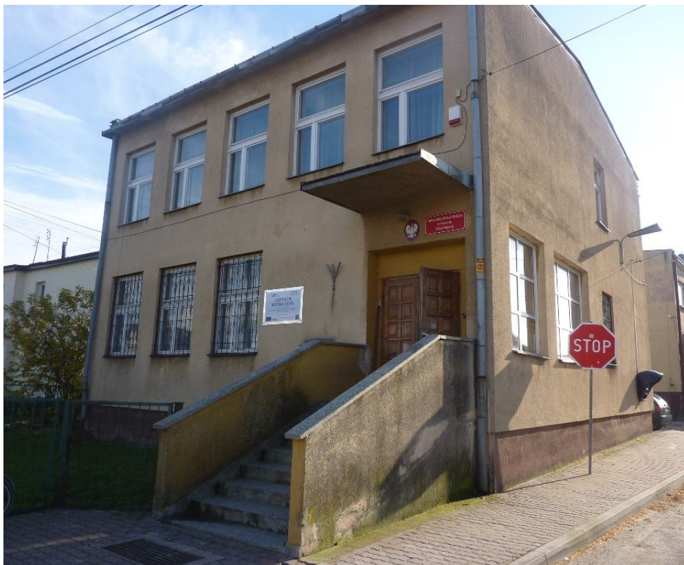
Zdjęcie nr 10. Gminna Biblioteka Publiczna - filia w Miąsowej wraz z świetlicą wiejską