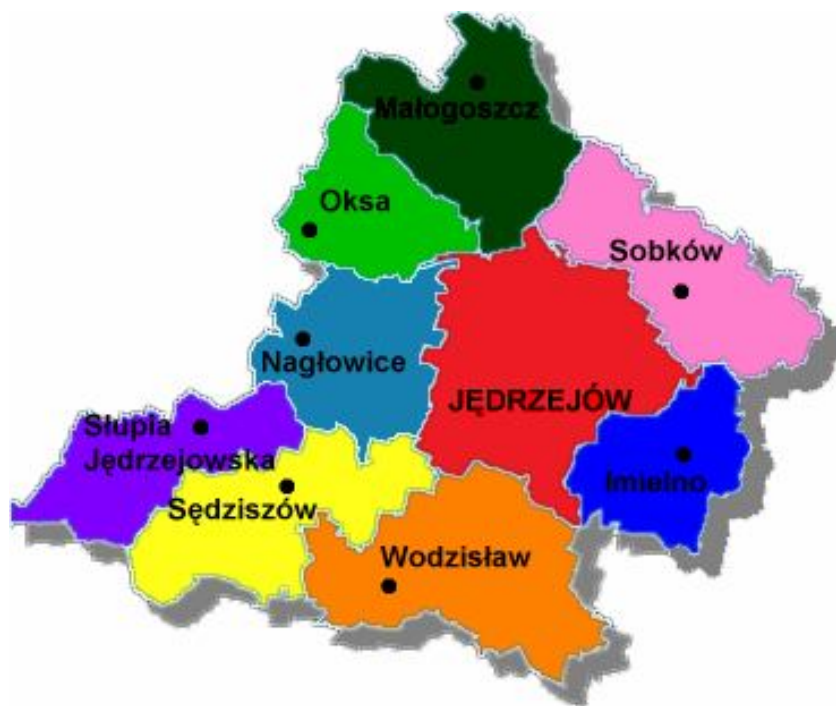
Mapa nr 1. Powiat Jędrzejowski

Gmina Sobków położona jest w centralnej części województwa świętokrzyskiego, w powiecie jędrzejowskim. Zajmuje jego północną część, sąsiadując bezpośrednio z gminami: Małogoszcz od północnego zachodu, Jędrzejów od zachodu, Imielno od południa, Kije od południowego wschodu (powiat pińczowski), Morawica od wschodu (powiat kielecki), Chęciny od północnego wschodu (powiat kielecki).