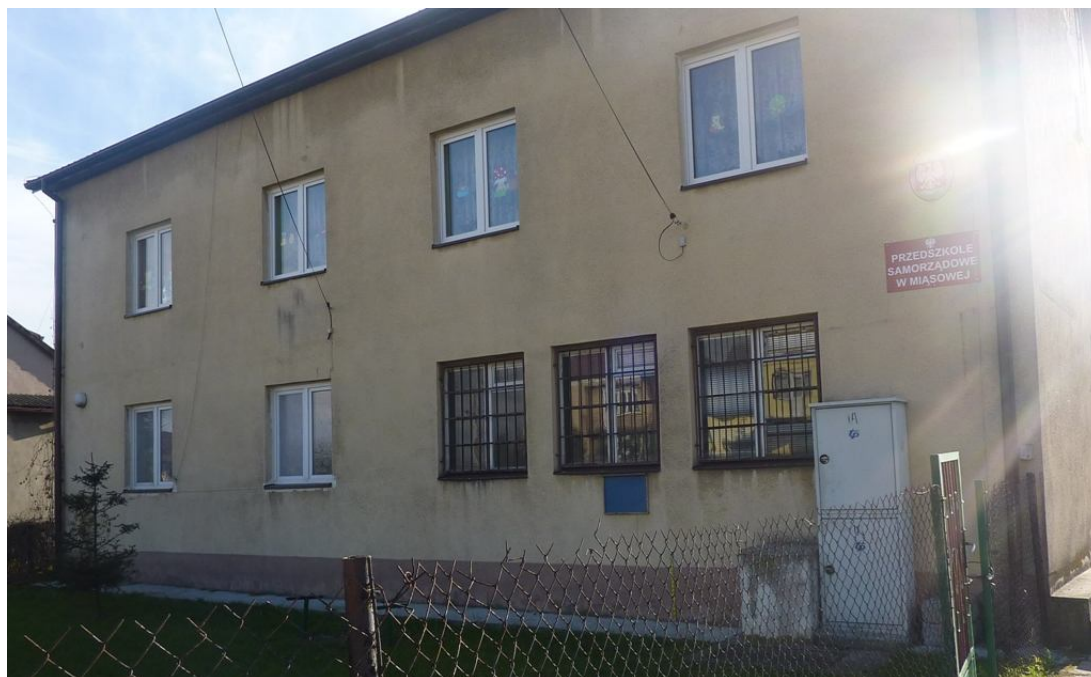
Zdjęcie nr 12. Przedszkole Samorządowe w Miąsowej