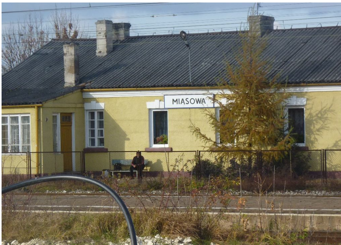
Zdjęcie nr 14. Stacja kolejowa Miąsowa