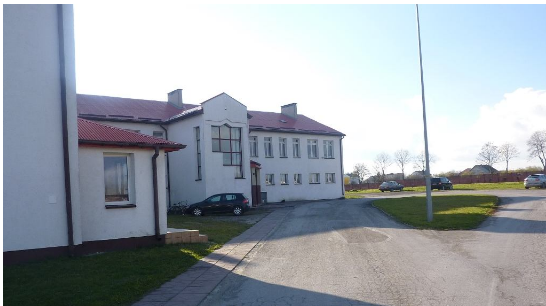
Zdjęcie nr 6. Zespół Placówek Oświatowych w Miąsowej