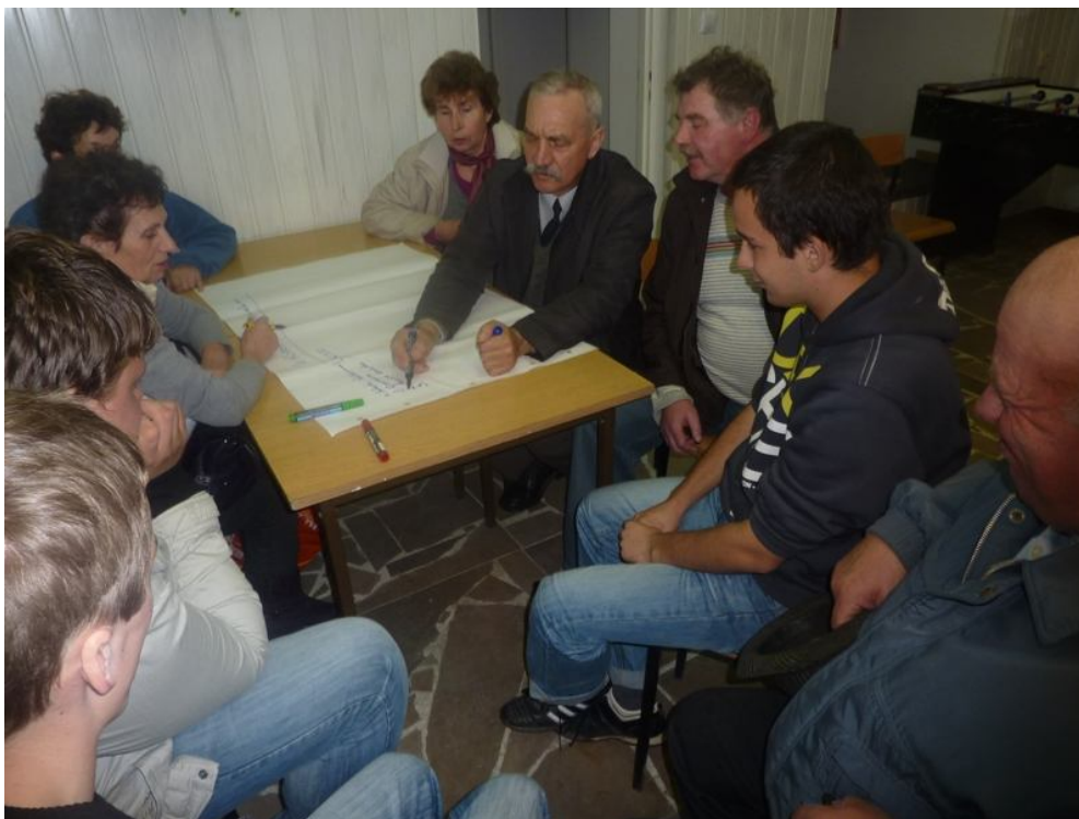
Zdjęcie nr 1 . Debata strategiczna 04.11.2010 r.