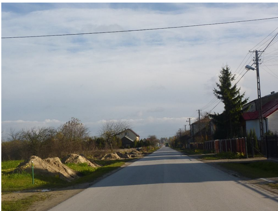
Zdjęcie nr 3. Układ przestrzennej struktury miejscowości

Miąsowa jest typem wsi „ulicówki” składającej się z dwóch głównych dróg przedzielonych torami kolejowymi. W miejscowości przeważają domy jednorodzinne. Dominuje budownictwo typu małomiasteczkowego z charakterystyczną dla niego strukturą obiektów zlokalizowanych wzdłuż głównej ulicy. Generalnie zakłada się utrzymanie wykształconych układów przestrzennych.