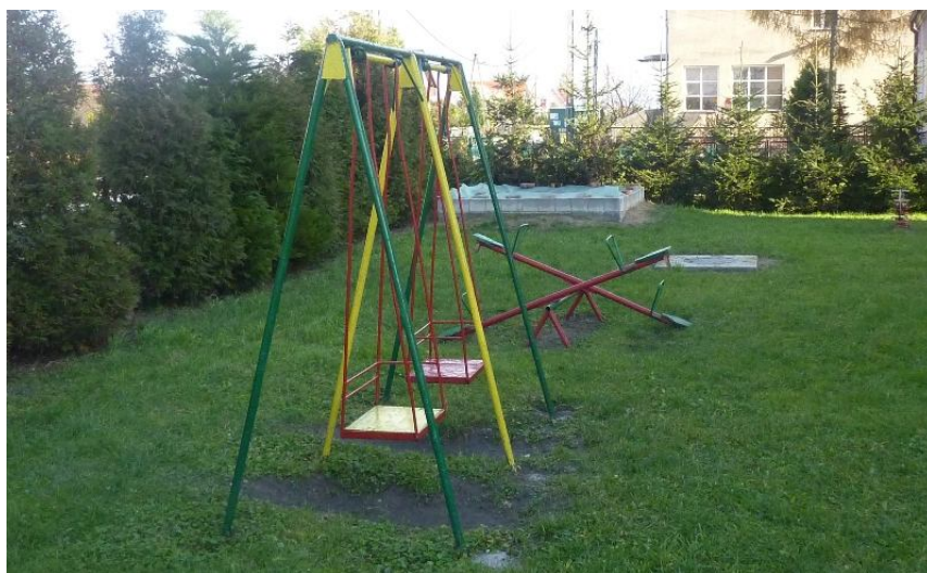
Zdjęcie nr 11. Plac zabaw na terenie Przedszkola Samorządowego

Na terenie miejscowości znajdują się również Przedszkole Samorządowe dla dzieci. Do przedszkola uczęszcza obecnie 26 „maluchów”. Na terenie obiektu znajdują się plac zabaw.