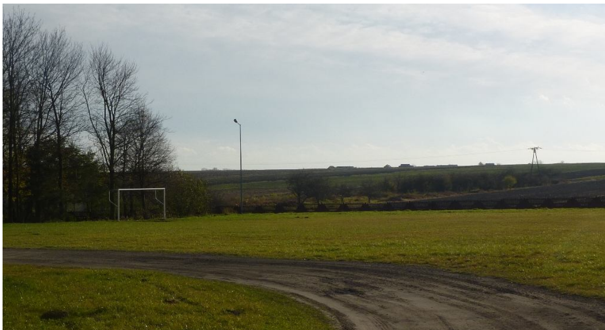
Zdjęcie nr 7. Boisko na terenie wokół ZPO w Miąsowej