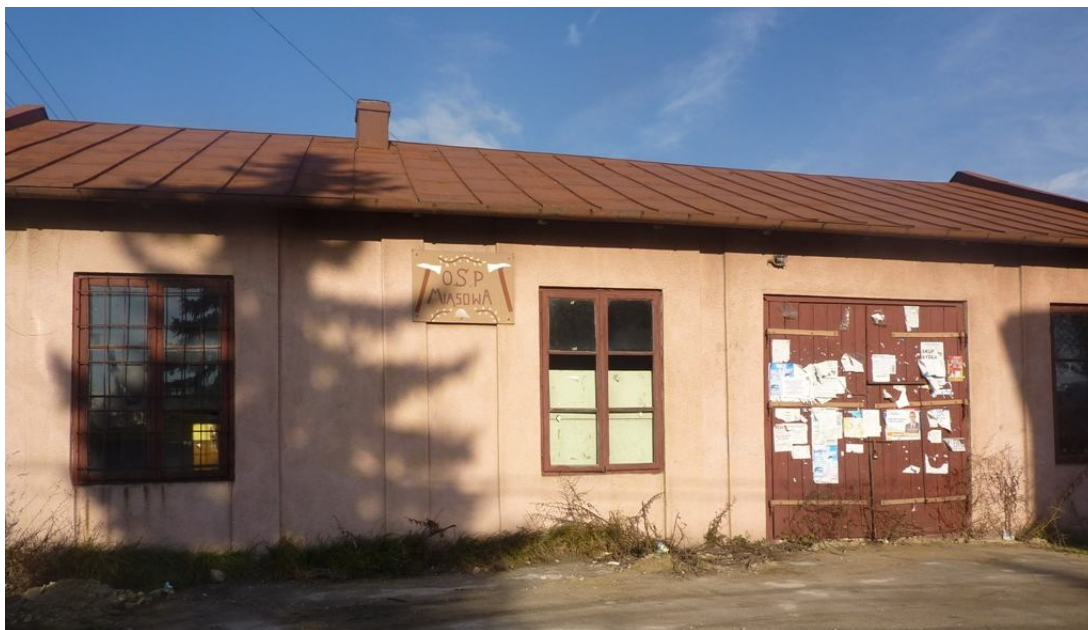
Zdjęcie nr 8. Remiza OSP Miąsowa