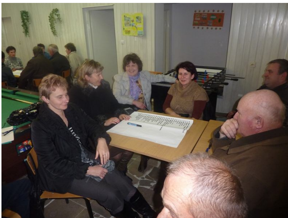
Zdjęcie nr 2 . Debata strategiczna 04.11.2010 r.