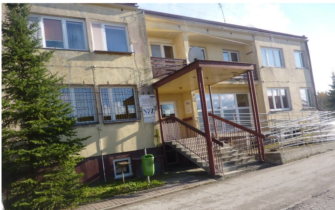
Zdjęcie nr 9. Ośrodek Zdrowia

Opiekę zdrowotną świadczy Ośrodek Zdrowia, w którym dostępna jest opieka ogólnolekarska i stomatologiczna.