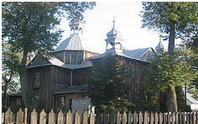
Zdjęcie 4: Kościół p.w. św. Szczepana Diakona w Mnichowie do którego parafii należą mieszkańcy miejscowości Miąsowa.

W Miąsowej jak w każdej miejscowości o charakterze wiejskim w jej krajobraz wpisują się przydrożne kapliczki i krzyże świadczące o religijnym charakterze mieszkańców. Na zebraniu roboczym mieszkańcy wskazali, że w miejscowości jest 6 krzyży przydrożnych.