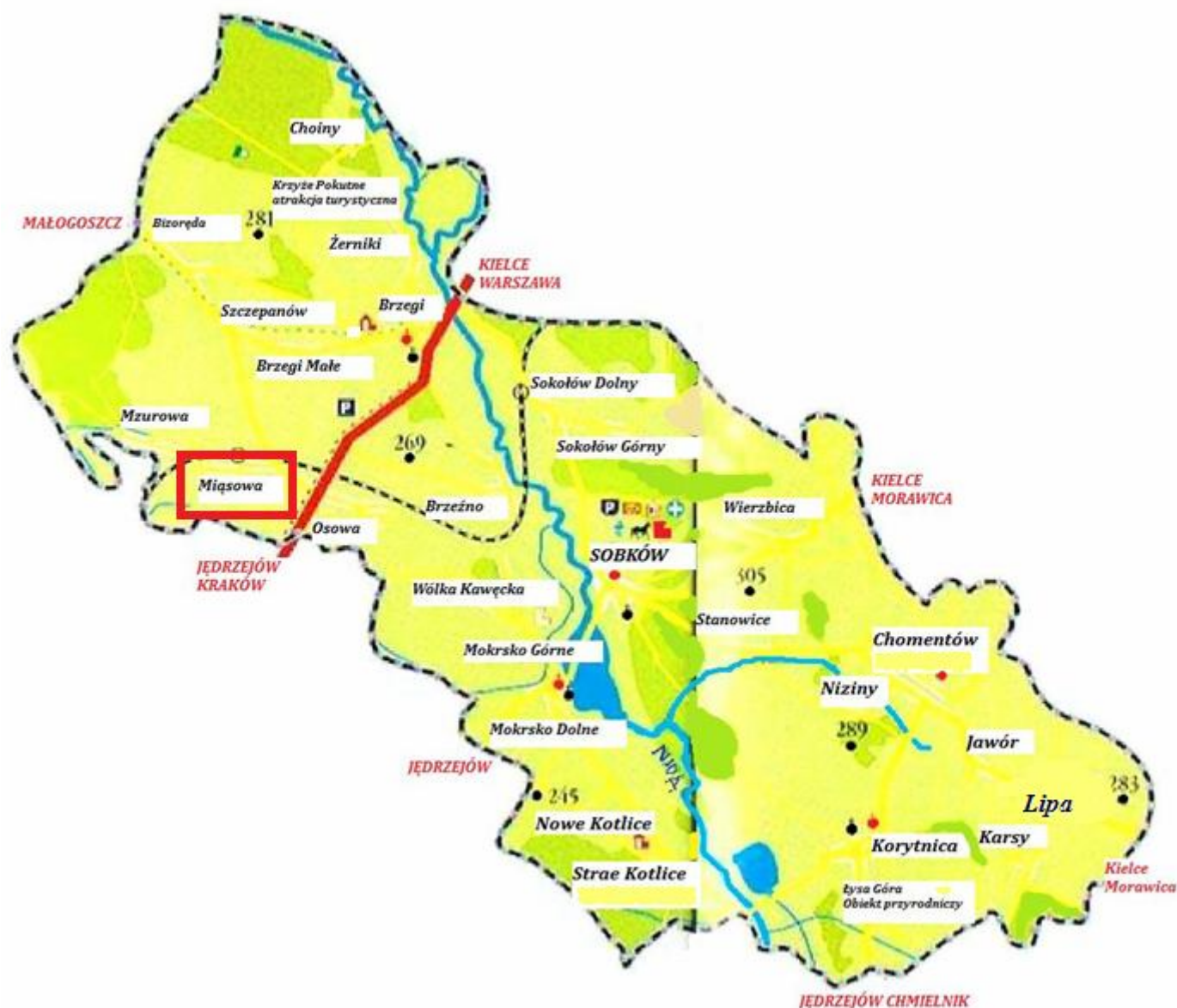
Mapa nr 2. Miejscowość Miąsowa na tle gminy Sobków

Miąsowa jest jednym z sołectw Gminy Sobków. W Gminie zlokalizowane są następujące sołectwa (25): Bizoręda, Brzeźno, Brzegi, Choiny, Chomentów, Jawór, Karsy, Korytnica, Lipa, Miąsowa , Mokrsko Dolne, Mokrsko Górne, Mzurowa, Niziny, Kotlice Nowe, Osowa, Sobków, Sokołów Dolny, Sokołów Górny, Staniowice, Kotlice Stare, Szczepanów, Wierzbica, Wólka Kawęcka, Żerniki.