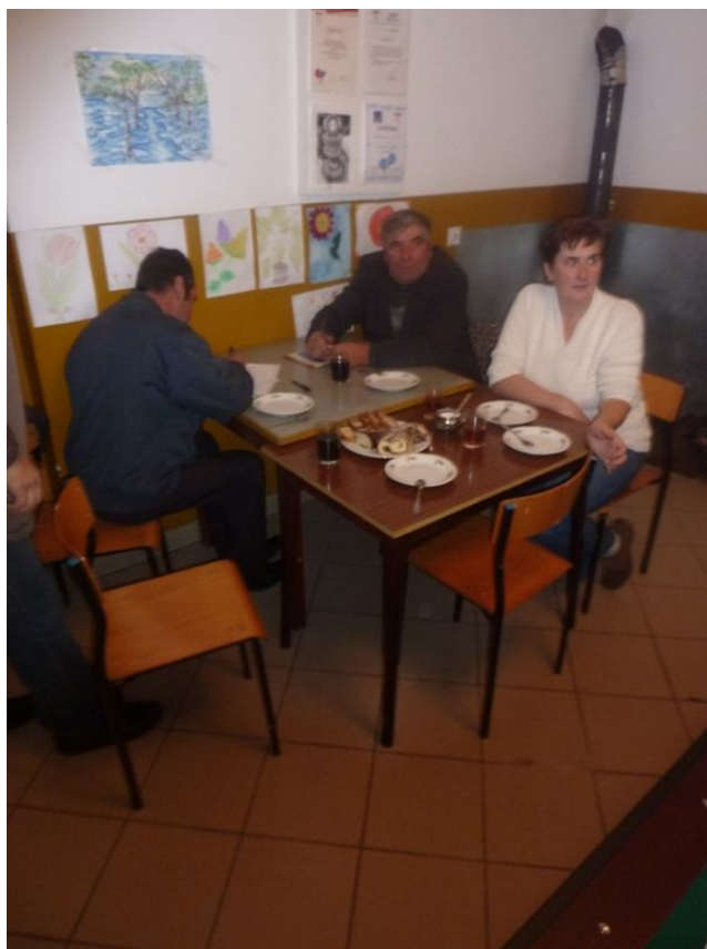
Zdjęcie nr 1 . Debata strategiczna

Łącznie w dyskusji wzięło udział 6 osób.