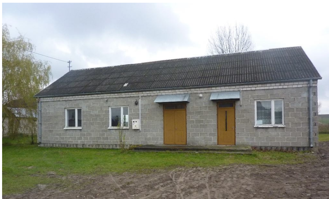
Zdjęcie nr 7. Świetlica wiejska w Wólce Kawęckiej