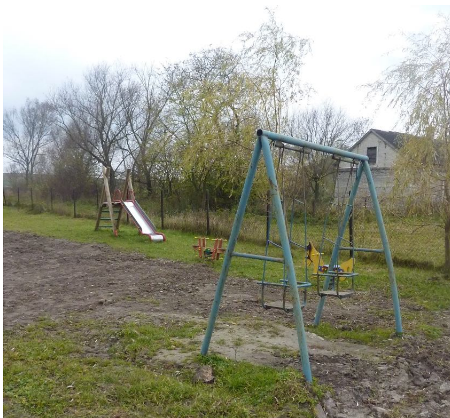
Zdjęcie nr 10. Plac zabaw na terenie świetlicy wiejskiej