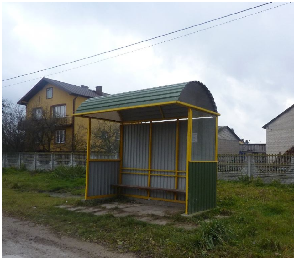
Zdjęcie nr 12. Przystanek autobusowy w Wólce Kawęckiej.