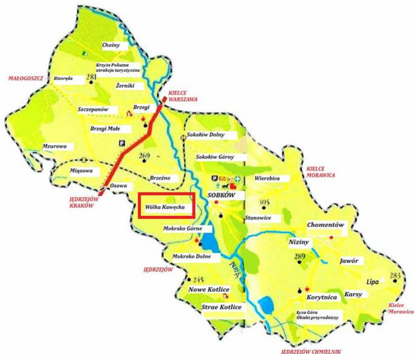
Mapa nr 2. Miejscowość Wólka Kawęcka na tle gminy Sobków

Wólka Kawęcka jest jednym z sołectw Gminy Sobków. W Gminie zlokalizowane są następujące sołectwa (25): Bizoręda, Brzeźno, Brzegi, Choiny, Chomentów, Jawór, Karsy, Korytnica, Lipa, Miąsowa, Mokrsko Dolne, Mokrsko Górne, Mzurowa, Niziny, Kotlice Nowe, Osowa, Sobków, Sokołów Dolny, Sokołów Górny, Staniowice, Kotlice Stare, Szczepanów, Wierzbica, Wólka Kawęcka , Żerniki.