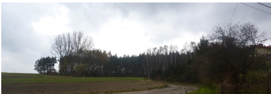
Zdjęcie nr 3 . Lasy w miejscowości Wólka Kawęcka

Atutem miejscowości Wólka Kawęcka jest położenie w zagłębieniu terenowym oraz bliskość lasów, które obfitują w grzyby, jagody i poziomki. Lasy są korytarzem czystego powietrza.