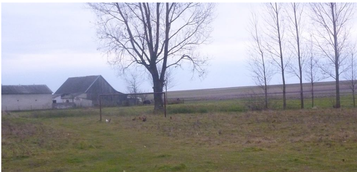
Zdjęcie nr 9. Boisko do piłki nożnej na terenie wspólnoty wiejskiej wsi Wólka Kawęcka.