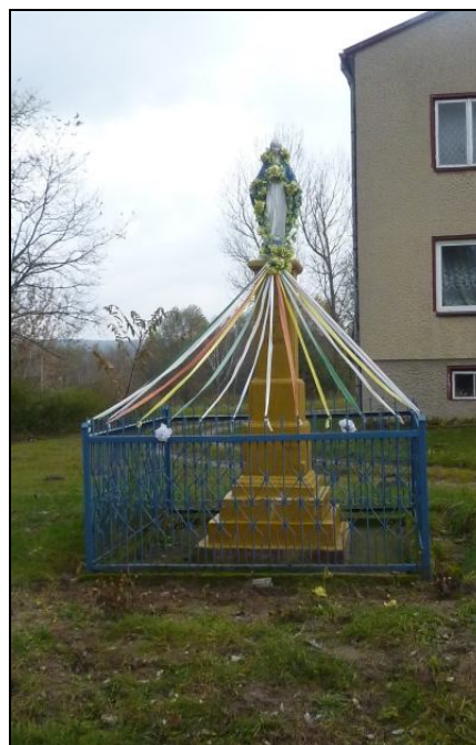
Zdjęcie nr 6. Przydrożne krzyże i kapliczki w miejscowości Wólka Kawęcka