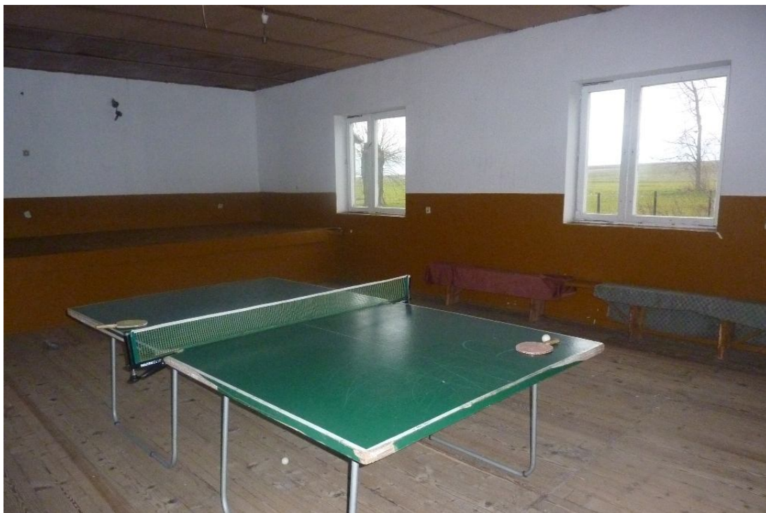
Zdjęcie nr 8. Pomieszczenie świetlicy wiejskiej.

Atutem miejscowości jest posiadanie przez wspólnotę wiejską obszaru o szacunkowej powierzchni 2,64 ha na której zlokalizowane są: świetlica wiejska, staw i boisko do piłki nożnej.