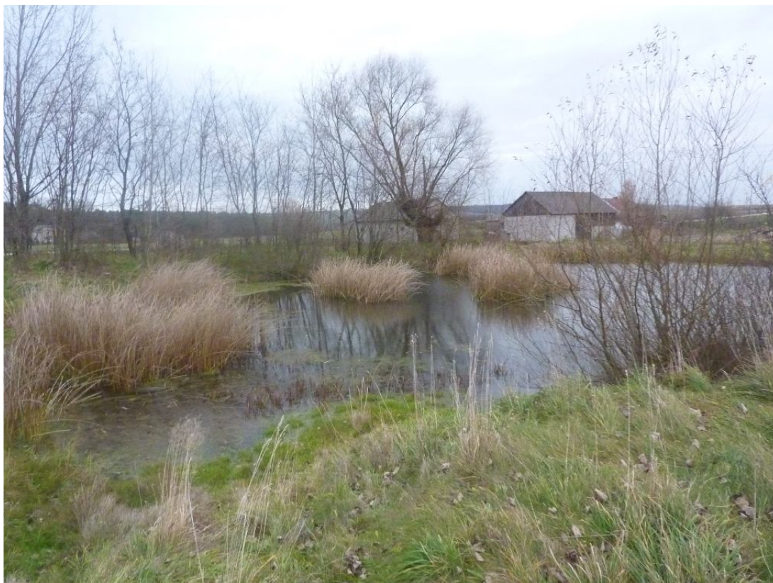
Zdjęcie nr 4. Staw