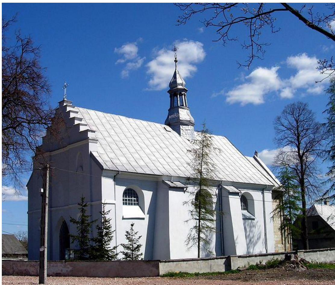
Zdjęcie nr 5. Kościół parafialny p.w. Wniebowzięcia NMP w Mokrsku Dolnym

Niewątpliwie atutem dla Wólki Kawęckiej jest znajdujący się w miejscowości Mokrsko Dolne kościół p.w. Wniebowzięcia NMP . Kościół murowany prawdopodobnie z poł. XIII wieku, rozbudowany etapami: nawa w 1676 roku, zakrystia w XVII wieku a kruchta w 1821 roku. Podczas II wojny światowej w 1945 roku kościół został uszkodzony natomiast w latach 50-tych odbudowany.