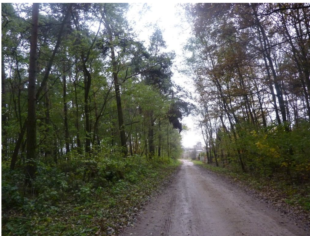
Zdjęcie nr 2 . Droga leśna dzieląca miejscowość Wólka Kawęcka

Cechą charakterystyczną układu osadniczego jest słabo wykształcone oraz zagospodarowane centrum. Rolę ośrodka skupiającego życie publiczne i społeczne pełni teren na którym zlokalizowana jest świątlica wiejska . Funkcję dominanty przestrzennej ze względu na położenie i kubaturę pełni budynek świątlicy.