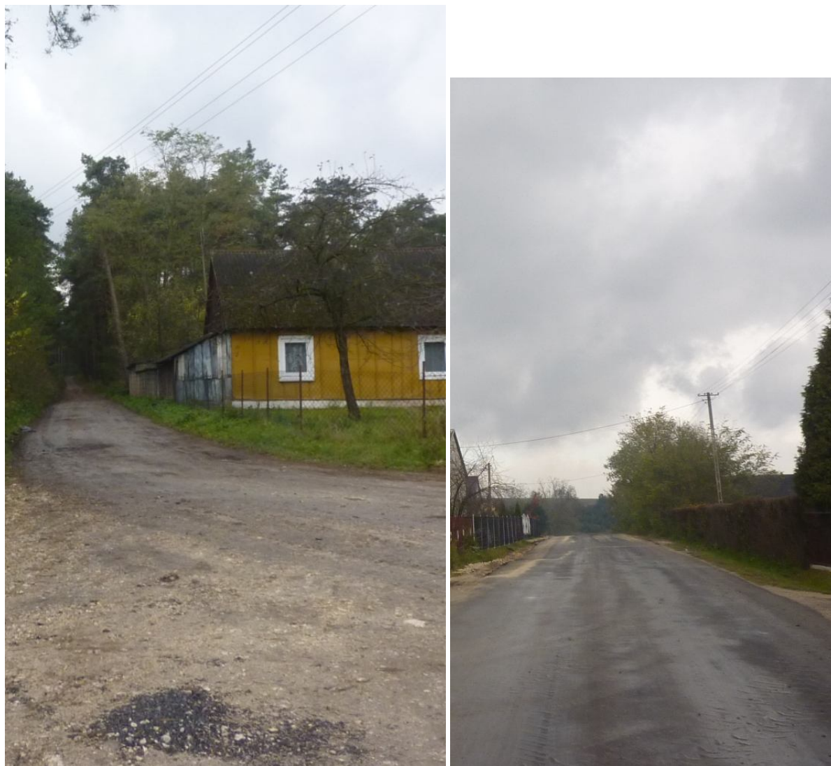
Zdjęcie nr 11. Drogi w miejscowości Wólka Kawęcka