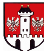
MIASTO I GMINA NOWY KORCZYN