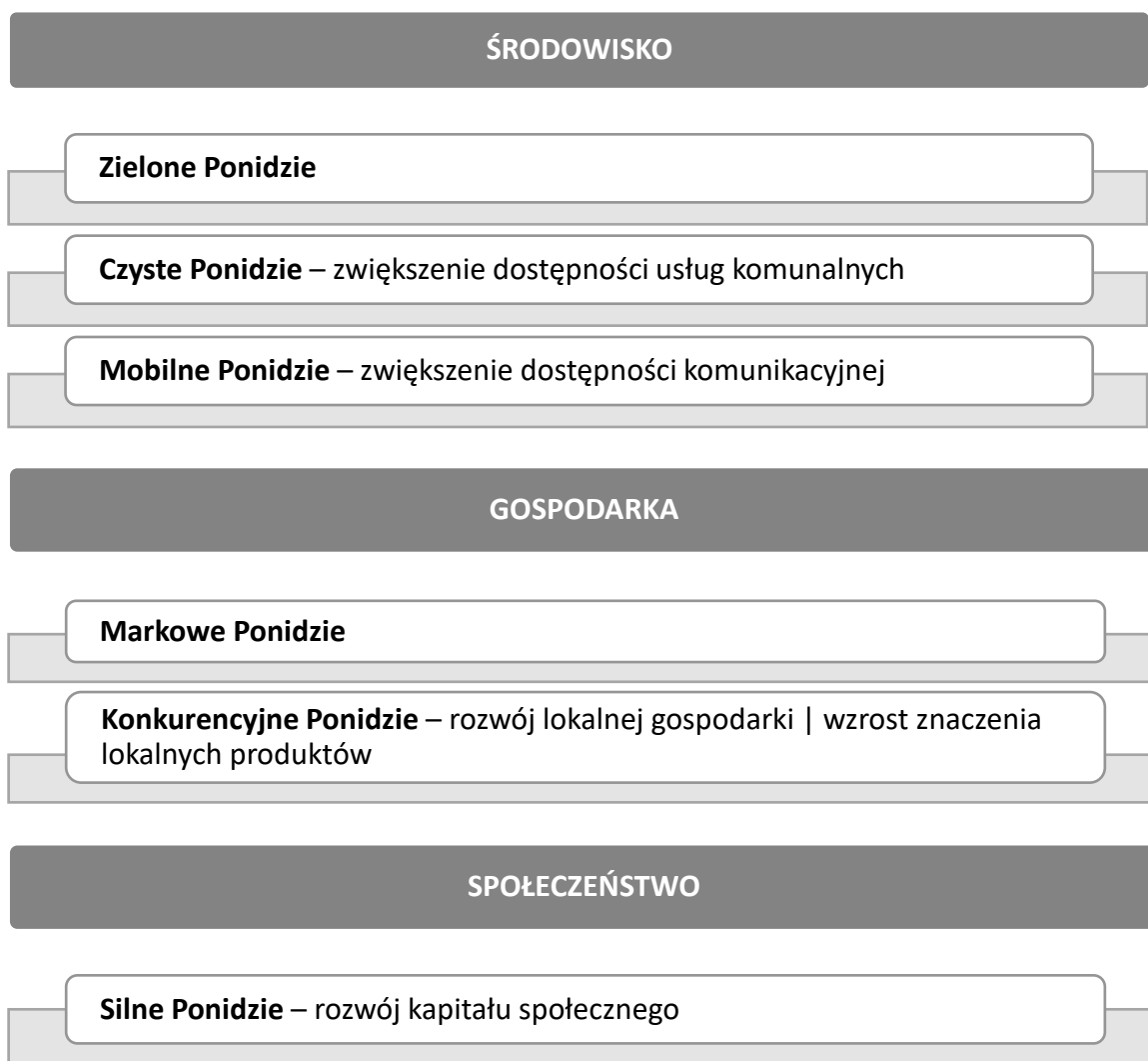
Ryc. 1. Cele strategiczne Partnerstwa Ponidzie.