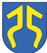
MIASTO I GMINA PIŃCZÓW