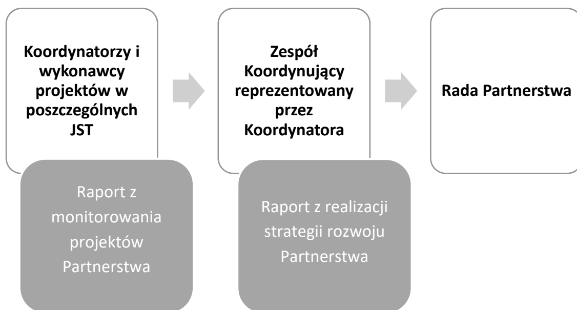
Ryc. 9. Etapy monitoringu strategii terytorialnej Partnerstwa.

Zadaniem Zespołu Koordynującego będzie analiza danych zawartych w raportach z monitorowania projektów oraz danych pochodzących z innych źródeł w celu określenie stopnia realizacji poszczególnych celów strategicznych. Koordynator Zespołu będzie odpowiedzialny za prezentowanie Radzie Partnerstwa zbiorczych raportów z wykonania projektów i osiągnięcia celów strategicznych wraz z rekomendacjami odnośnie dalszego jej wdrażania. W uzasadnionych przypadkach Koordynator Zespołu w imieniu Zespołu Koordynującego będzie miał możliwość złożenia wniosku o aktualizację dokumentu strategii.