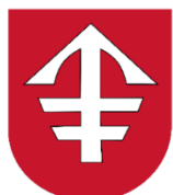
MIASTO I GMINA JĘDRZEJÓW